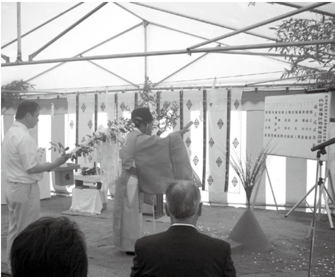
内原東地区処理施設起工式

問 設計額と調査基準価格は。 上下水道課長 設計額5億3918万円(消費税抜き)、調査基準価格4億5255万3千円(消費税抜き)。