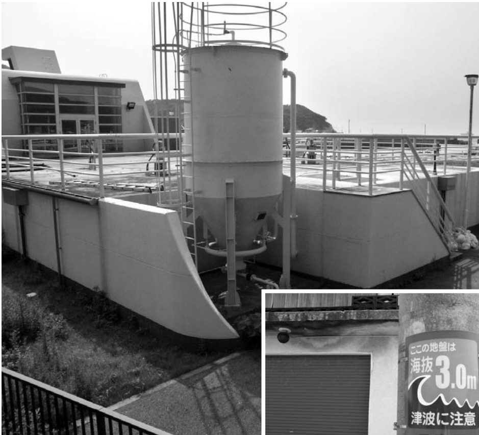
阿尾処理場と海拔表示板