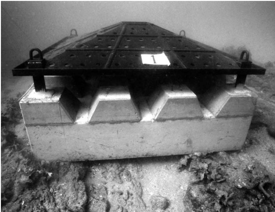
海の砂漠化を防止する铸铁製藻場増殖礁（比井地先海中にて）

問 地球温暖化対策の取り組みを伺いたい。 町長 現在17年度中の燃料使用量や電気使用量等の数値を調査中である。調査が終わり次第、助役を中心に温暖化対策実行計画推進体制を構成し、10月までには削減数値を出したい。