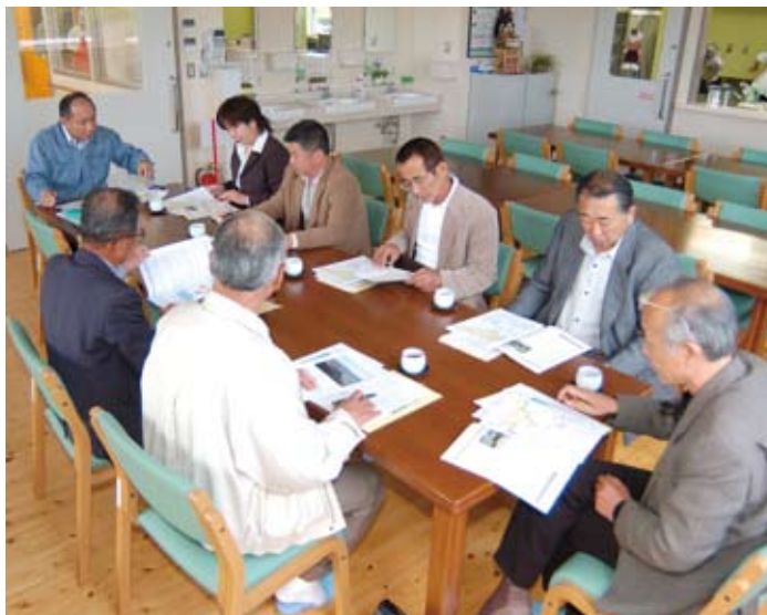
「パン工房サンフルひだか」にて