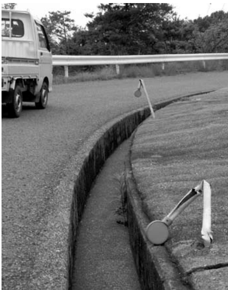
破損がひどい反射鏡

易手洗所等設置できないか、また場所、水の問題、費用その他について、検討していきたいと思っています。しかし、その中でも一番の問題は水であるので十分勉強していきたい。