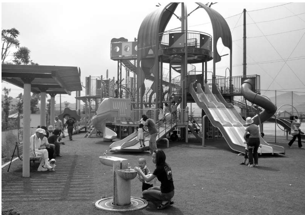
明恵の里公園（有田川町）

場所を作りた いと考えてい る。 問 子供達に 人気の出る公 園としては遊 具の設置が一 つ大きな要素 になると思っ た。 町長 現時点 で、具体的に どのような遊 具を設置する という構想は まだ持ってい ない。 今後処理場 の完成時期を にらみながら また、予算も 考慮しながら 具体的な構想 を練っていき たい。