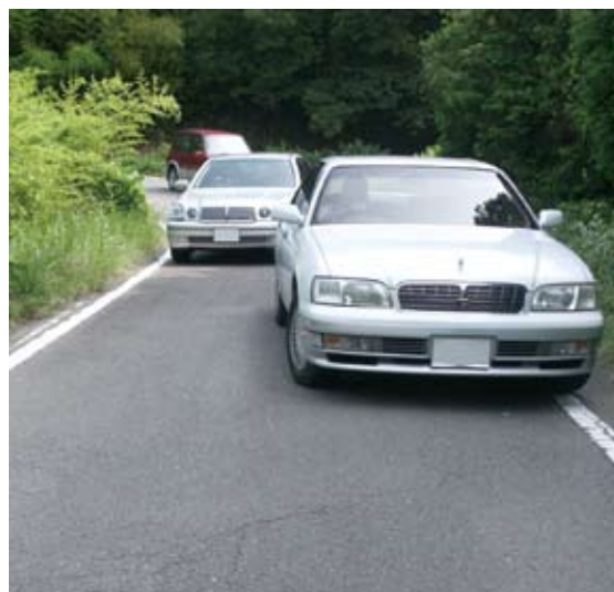
早期改修を望む（県道井関御坊線）