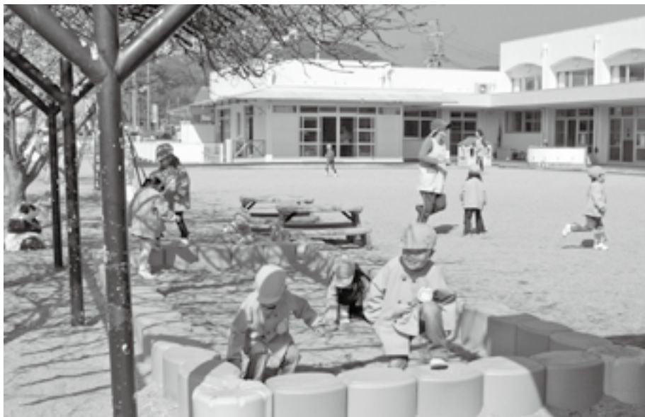
充実した保育行政を

問 平成19年度より始めた委託業務について。当町は、保育士のみ派遣会社に委託している理由は。 町長 従来の臨時職員としての保育士は、御坊・日高地方においては人材不足であり、必要人員を確保することが非常に困難な状況にある。 当町では、平成18年には必要人数を確保することができず非常に苦しい保育運営になり、保育業務の向上を常に考えていかなければならないにもかかわらず、現状を維持するのが精一杯であった。 そこで和歌山県ではまだ実績がなかったが、全国的には派遣保育士が普及してきており、厳しい財政事情の中で保育の充実を図るには現時点では最良ではないかと判断し