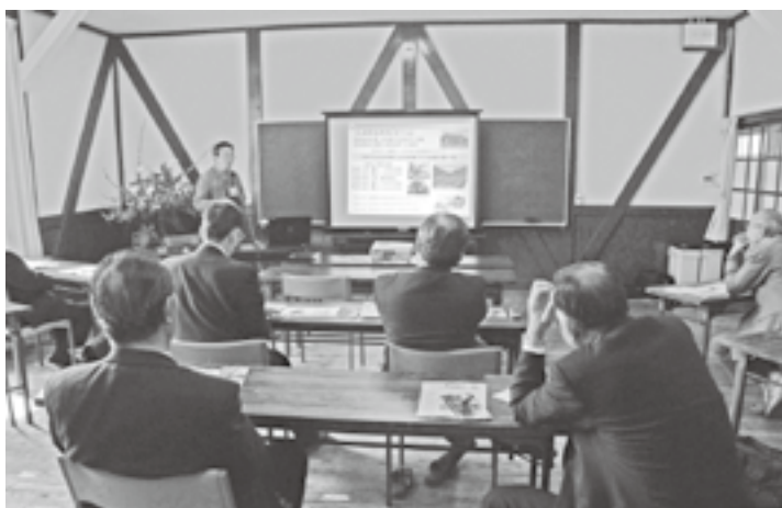
秋津野ガルテンでの視察研修

また、所得の向上にともない担い手の確保、後継者づくりに魅力ある農業経営に取り組み、積極的な村づくり活動を自分たちで展開していると感じた。