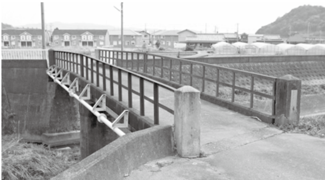
改良が待たれる（天満井橋）