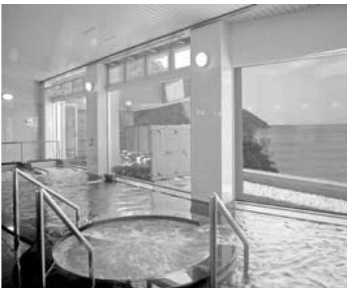
これ以上の投資は？