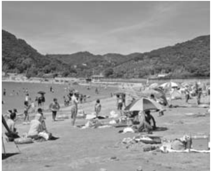
駐車場がなければ海水浴場は無理

問 産湯海水浴場前の土地（駐車場として借地）が売却予定地となつて問題になっているが、第三者に売却となると、駐車場なしの海水浴場となり開設は不可能に近い。またその後、(有)産湯海水浴場も、解散する旨報告があったが、クエ、温泉館とともに海水浴場も重要な観光資源である。現実をどのように考えているか。