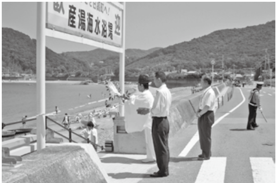
平成20年7月の海開き

また、土地の購入に対 しては、適正な価格で購 入すること。 運営管理等の受け皿作 りが必要不可欠であるな どの意見があった。 採決した結果、全員賛 成して採択となった。 その後、本会議におい て審査の結果、全員賛成 した。