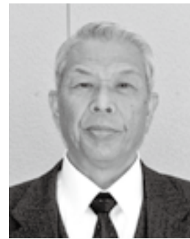
教育長 玉石 守氏