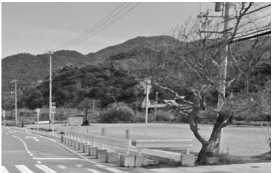
今後の利用方法は（産湯海水浴場）

問 比井小学校の運動場や、産湯海水浴場の駐車場の土地を確保してはどうか。また、産湯の土地については、色々な利用もできる。 町長 是非考えてはどうか。 町長 比井小については、小型ヘリコプターであれば、利用できる。 問 海水浴場の土地は、民間会社の了解が必要である。 町長 太陽光や風力を利用した避難誘導灯の設置を検討しては。