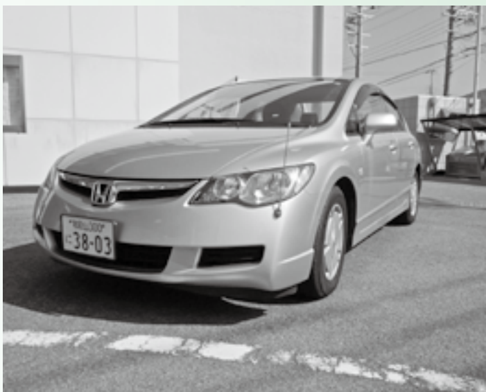
ハイブリッド公用車

総務政策課長 要綱では3割を基金として計上出来るが、この点も含め検討して決定した。