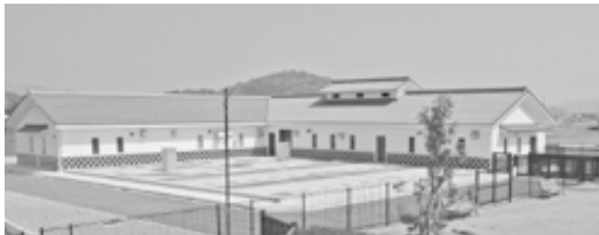
今年度で下水道事業全体が完了（写真は高家処理場）

上下水道課長 市町村設置型として5カ年計画で実施してきた交付金事業としての個別型事業については本年度で全て完了となる。