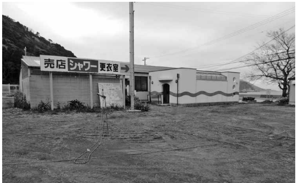
海の家建設予定地

問 新しくなる海の家の利用について問う。 産業建設参事 サーフインの大会、店頭市等1年中利用できるよう担当課で検討している。