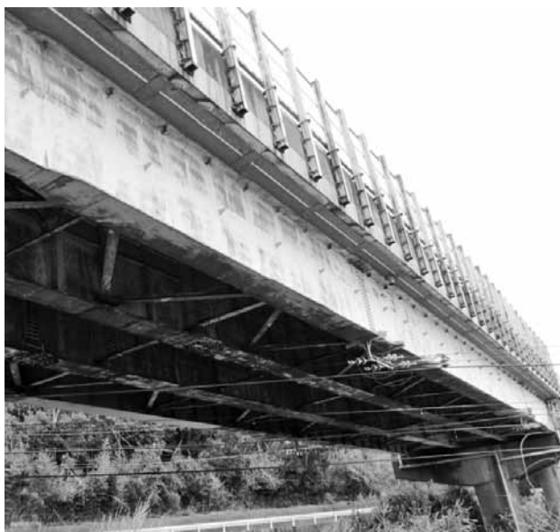
橋梁長寿命化工事（萩原跨線橋）

問 現在お借りしている海の家は。 産業建設参事 産湯区長とも話し合いをしている段階だが、撤去してもらえるのであれば駐車場用地としてお借りしたいと伝えている。