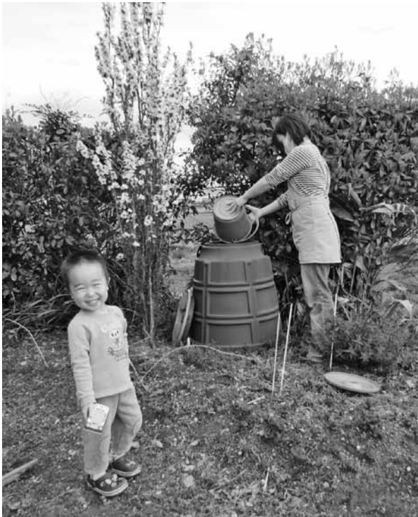
コンポストで生ごみを堆肥化

町長 今すぐ取り組めることとして、毎日出る生ごみを、資源として再利用する「日高町生ごみ堆肥化運動」を広げていけばどうか。