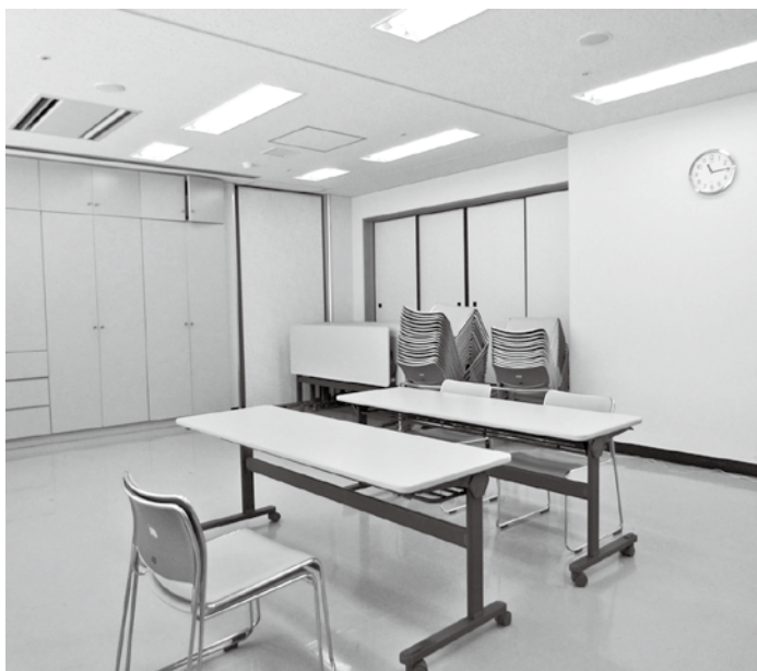
開設される子育て支援センター（ふれあいセンター内）

教育課長 常時保育と臨時保育があり、昨年度より利用者が増加したため、ひとつ上のランクで補助申請をした。そのため増額となっている。