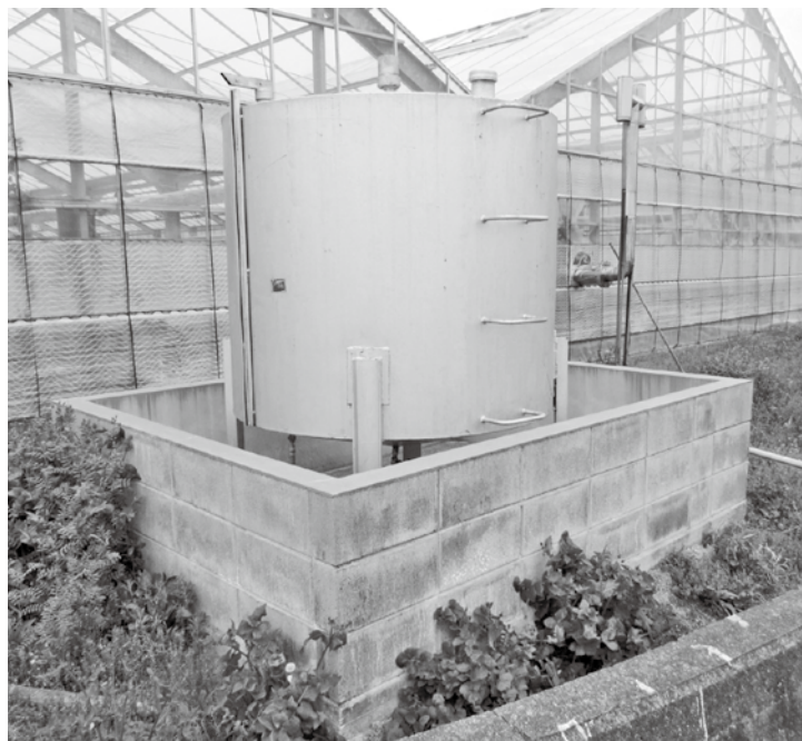
補助金で設置した防油堤