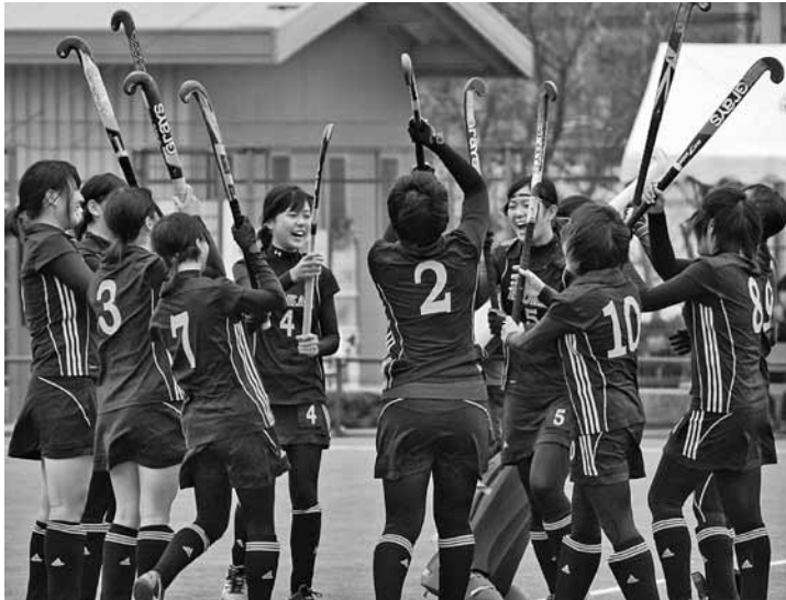
優勝を目指し日々練習（紀史館高校）

問 平成27年に、第70回紀の国わかやま国体が開催され、日高町は少年男女のホッケー競技を受け入れる。 今後の予定は。