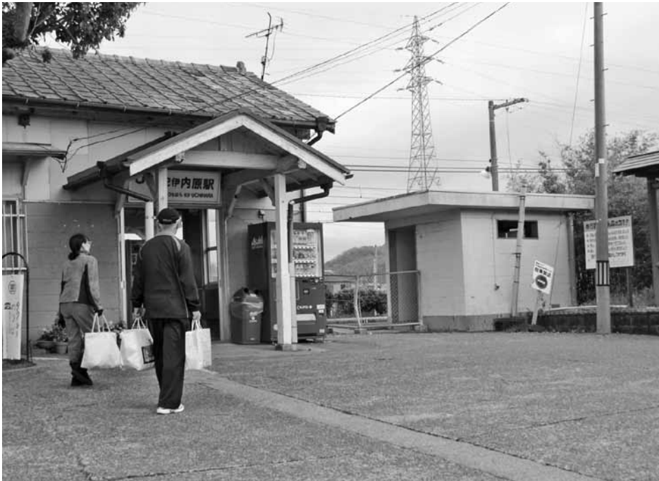
日高町の玄関口紀伊内原駅に衛生的なトイレを

問 紀伊内原駅のトイレを、日高町の玄関口にふさわしい衛生的なトイレにしてほしいというのは、駅利用者のみならず多くの住民の望みでもあると考える。