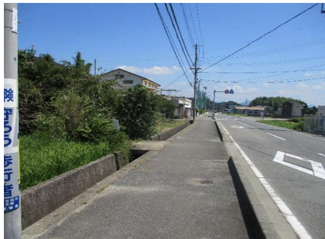
⑤ 県道柏御坊線（志賀小学校周辺） 水路に柵がない。