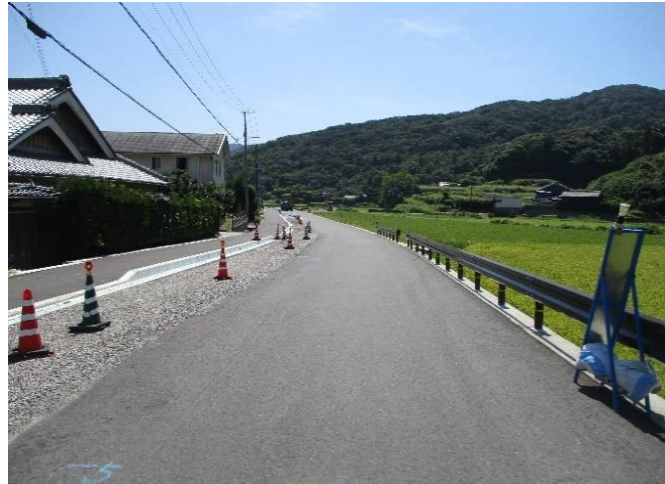
④ 県道柏御坊線（中志賀～久志） 歩道が未整備の部分があり、 現在工事中である。