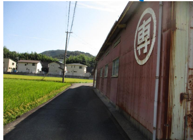
⑧ 町道谷口中志賀線（中志賀） 住宅が増えてきているが、 道路が狭いままである。