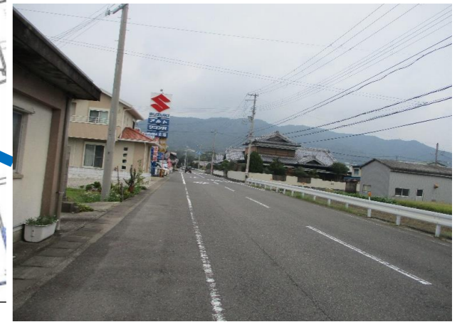
⑦ 県道柏御坊線（下志賀・谷口） 歩道がない。