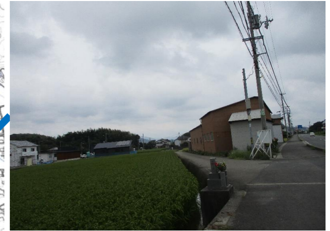
⑥ 町道長堤川原線（下志賀） 登校時、自動車や自転車の 通行量が多い。 住宅が増えてきている。