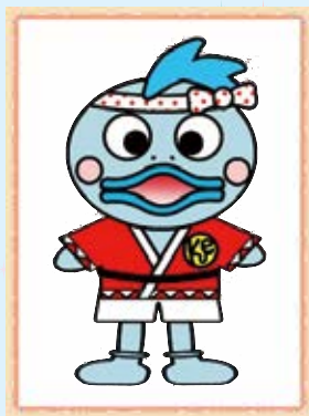
くえたらう クエ太郎くん (△歳)