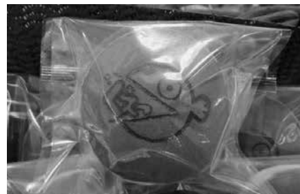
西谷屋製菓の人気商品 「クエどら」

ご入館のお客様先着100名様ずつに「クエどら」を プレゼントいたします(※お一人様1個限り)。 皆さまお誘いあわせのうえ、ご来館ください。