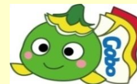
ハローワーク御坊マスコットキャラクター まめびー