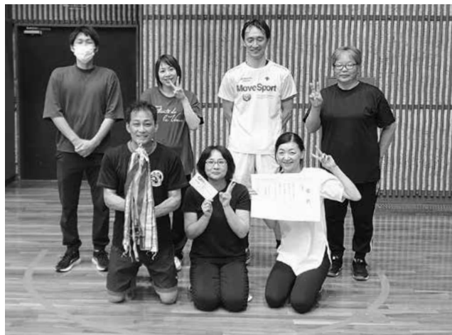
準優勝：荊木レジェンドチーム