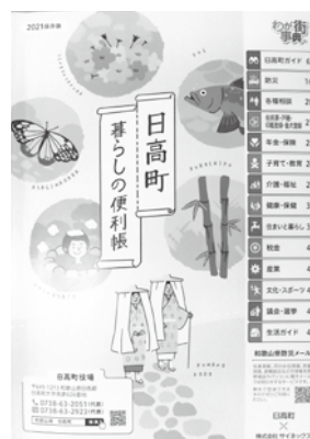
2021年版 暮らしの便利帳